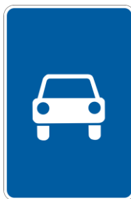
Дорога для автомобилей