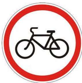
«Движение на велосипедах запрещено»