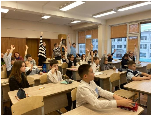
Активные читатели 5А класса!