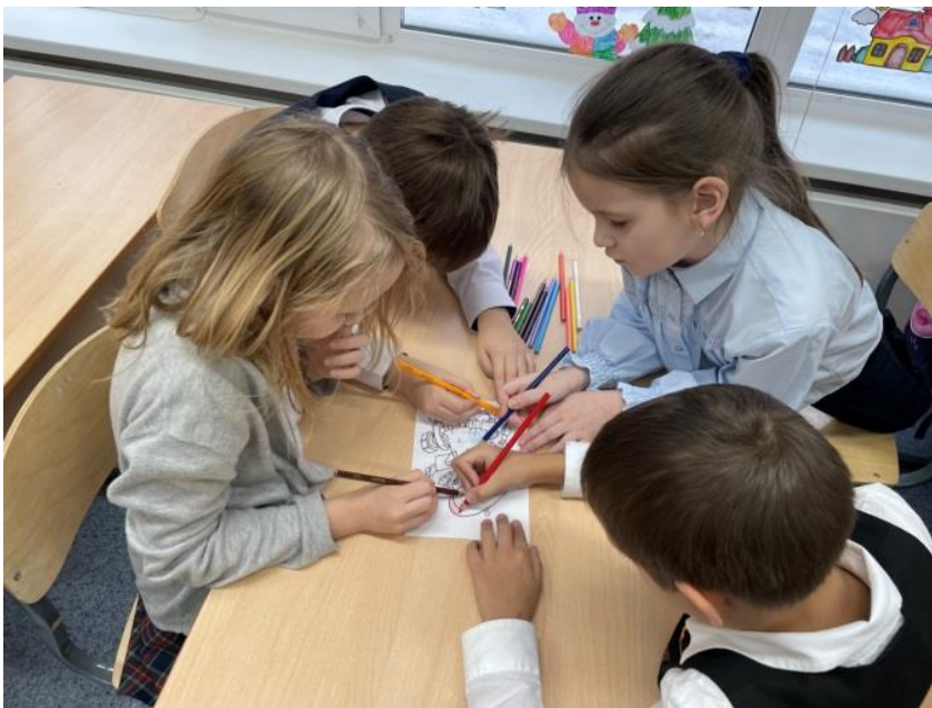
Игра-квест «По следам Незнайки» в параллели 2-х классов.