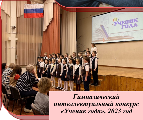
Гимназический интеллектуальный конкурс «Ученик года», 2023 год