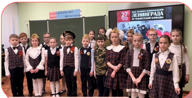
День памяти снятия блокады Ленинграда, 2023 год, 2 «Б» класс