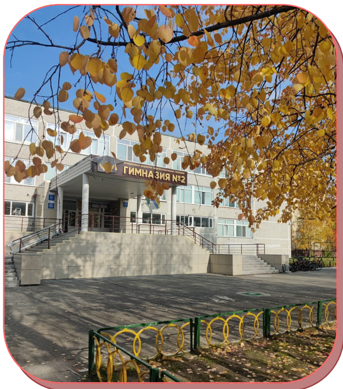
Гимназия №2, сентябрь 2023 год