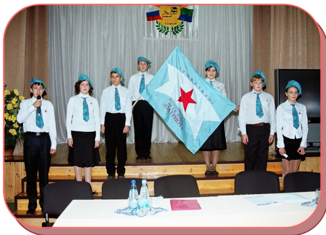
Объединение им. Г. К. Жукова «Патриот», 2006 год