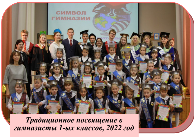
Традиционное посвящение в гимназисты 1-ых классов, 2022 год