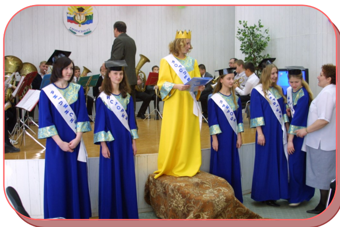
Посвящение в гимназисты, 2003 год

лет гимназисты остаются такими же деятельными и неравнодушными: они собирают посылки солдатам, отправляют в приюты для жи-