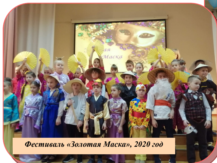
Фестиваль «Золотая Маска», 2020 год