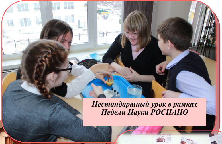
Нестандартный урок в рамках Недели Науки РОСНАНО