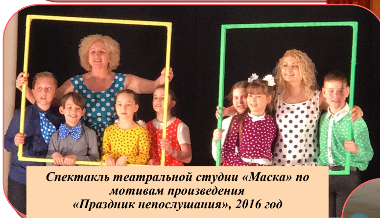
Спектакль театральной студии «Маска» по мотивам произведения «Праздник непослушания», 2016 год