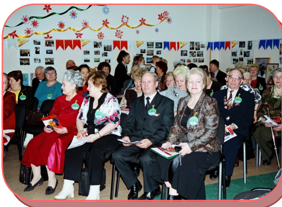
Чествование ветеранов, 2005 год

свою педагогическую деятельность с самого основания гимназии №2, учат уже не первое поколение детей, воспитывают самостоятельных, ответственных граждан, умеющих грамотно мыслить, использовать знания на практике и учиться новому. Сильный педагогический состав, мастера своего дела, не раз доказывали, что труд учителя – почетная и трудоемкая работа.