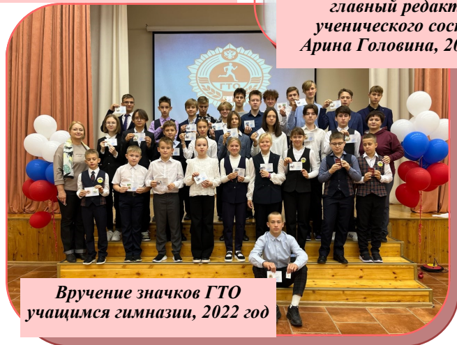
Вручение значков ГТО учащимся гимназии, 2022 год