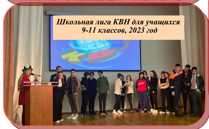
Школьная лига КВН для учащихся 9-11 классов, 2023 год